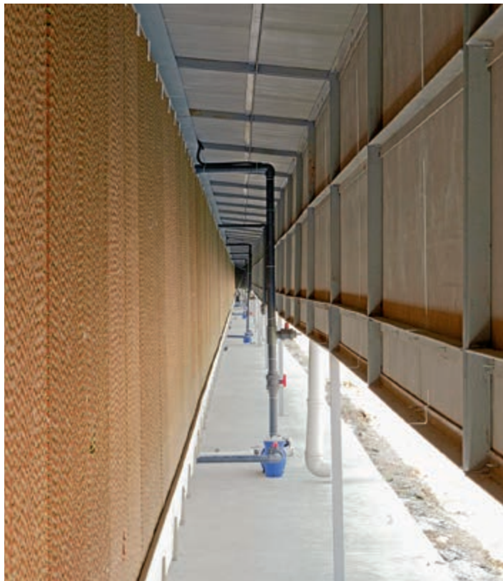
Szél- és porvédelem, valamint a Pad nincs kitéve közvetlen napsugárzásnak