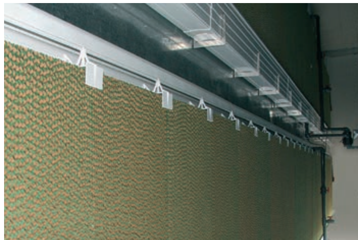
Dupla RainMaker rendszer nagy belmagasságú ketreces istállóhoz