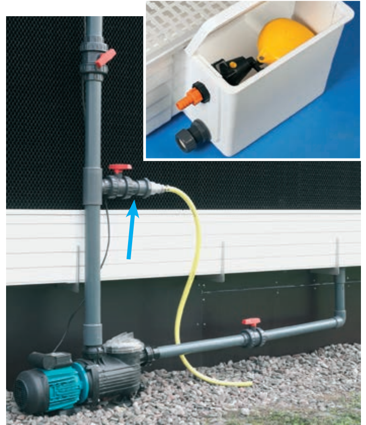
Keringető szivattyú szűrővel és leeresztővel

A RainMaker, üzem közben, a víz egy részét elpárologtatja és az ásványi anyag tartalom a keringő vízben nő. A Pad betéteken való lerakódások megelőzésére ennek a víznek egy részét folyamatosan el kell vezetni egy vízleeresztőn keresztül (Bleed off). Az elvezetendő mennyiség a vízminőségtől és az elpárologtatott víz mennyiségétől függ. Ököl szabályként érvényes: az átfolyó víz 10%-a (jó minőség esetén). Opcióként kínálunk egy ellátó egységet. Ez megkönnyíti a karbantartási munkákat, mivel könnyebb hozzá férni az úszószelepphez.