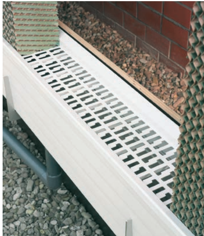
Vízfelfogó vályú méterenként 48 liter vízmennyiségig

A felesleges vizet a vázszerkezet alsó részében – víztároló vályúban – fogják fel és újra visszavezetik a hűtővíz körbe. A speciális profil kialakítás jó stabilitást biztosít. A vályút úgy méretezték, hogy további víztankra nincs szükség. A vályút fedő burkolatot, amin a Pad betétek állnak, egyszerűen rápatintják a vályúra és karbantartási munkák esetén le lehet venni. A speciális perforáció biztosítja a felesleges vízmennyiség visszafolyását és egyben megakadályozza a rágcsálók bejutását a vályúba.