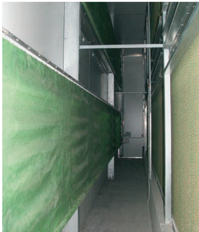
Alagút légbeejtő rolós függönnyel