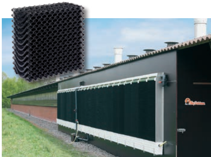
RainMaker, műanyag Pad betétekkel

zásra, ahol forró és száraz a nyár. Mert a hűtőhatás annál nagyobb, minél magasabb a hőmérséklet és minél kisebb a relatív páratartalom. Az alkalmazásra kerülő Pad betétek speciális cellulózsövetből készülnek különösen nagy felülettel → magas hűtési teljesítmény. A kémiai impregnálás védi a Pad betéteket az időjárási behatásoktól. Alternatívaként kínálunk még műanyag betétet is, mely könnyebben takarítható és hosszabb élettartamú.