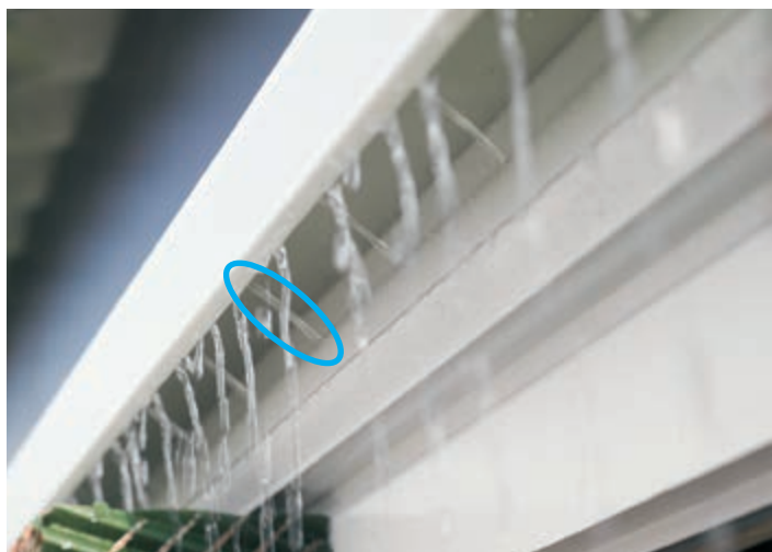
Top profil perforált vízvezető csővel és a deflektorral, mely az egyenletes vízelosztást biztosítja a betét tetejére